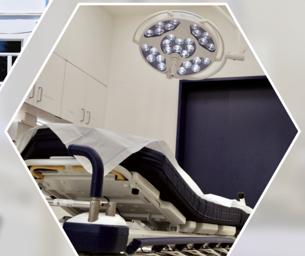
ZOLLERN ALB KLINIKUM OP NEUE NOTAUFNAHME