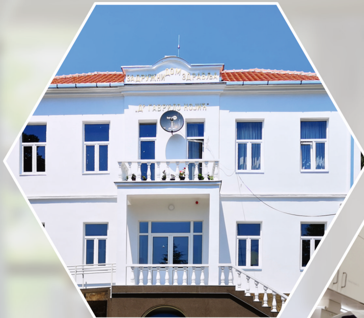
HOSPITAL BANJANI IN UB