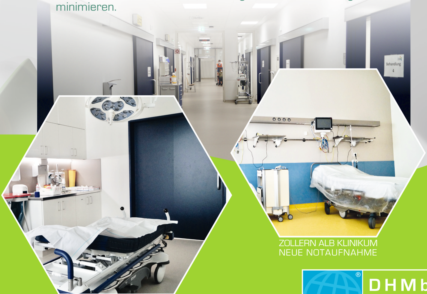
ZOLLERN ALB KLINIKUM OP NEUE NOTAUFNAHME

Laut Tests von akkreditierten Laboren kann MIG-ESP® Interior Anti-Microbial nachweislich 99,99 % der schädlichen Keime abtöten . Dies hilft, die Verbreitung von Infektionserregern zu minimieren.